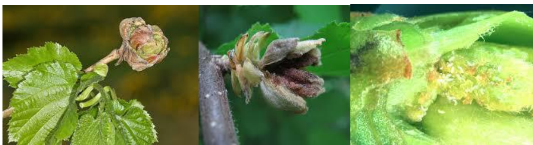
Gemma parassitata ancora chiusa